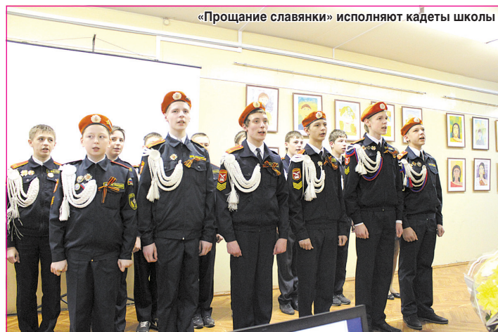
«Прощание славянки» исполняют кадеты школы

Эта награда учреждена 21 декабря 2013 г. Указом Президента России для участников и инвалидов войны, тружеников тыла, блокадников и бывших узников фашистских концентрационных лагерей.