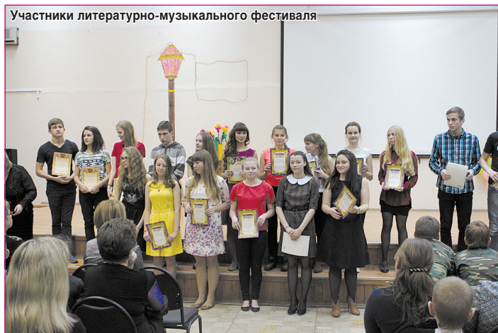
Участники литературно-музыкального фестиваля