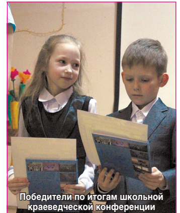
Победители по итогам школьной краеведческой конференции

Одной из самых интересных частей концерта была краеведческая. Готовясь к празднованию 70-летия Победы в Великой Отечественной войне, школьники подготовили рассказы о своих родственниках-ве-