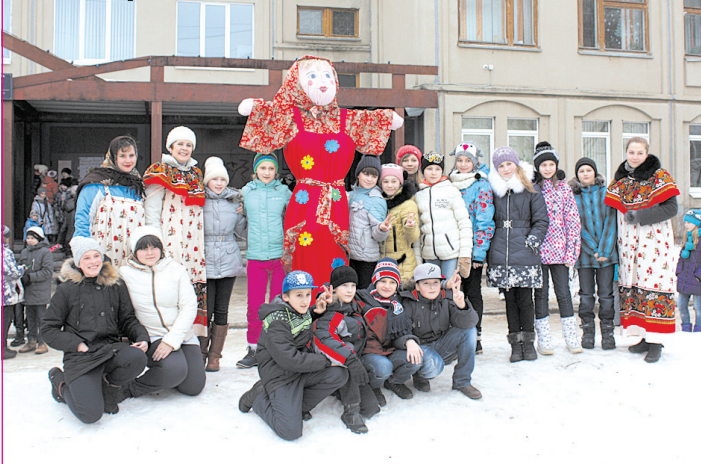
В ожидании праздника

На снимках: веселые моменты школьной Масленицы.