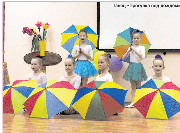
Танец «Прогулка под дождем»