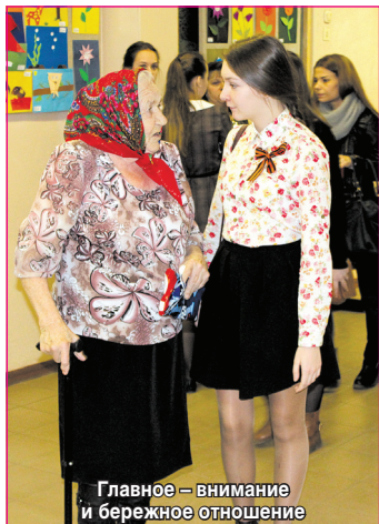
Главное – внимание и бережное отношение