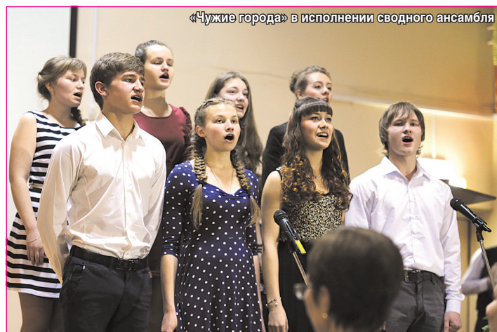
«Чужие города» в исполнении сводного ансамбля