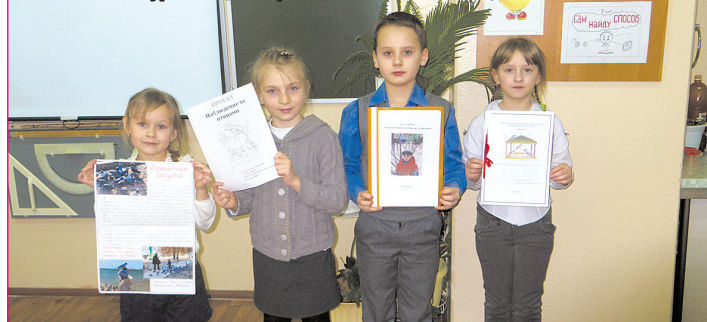
Участники конкурса защиты проектов

1) Орнитолог – биолог, специализирующийся на изучении птиц. Данный термин «орнитолог» пришел к нам из греческого языка, он образован от сочетания слов ornis – птица и logos – наука, изучать. Впервые, научная деятельность по изучению птиц была описана термином «Орнитология», еще в далеком 16 веке, и сделал это известный ученый-натуралист итальянского происхождения Улиссе Альдрованди.