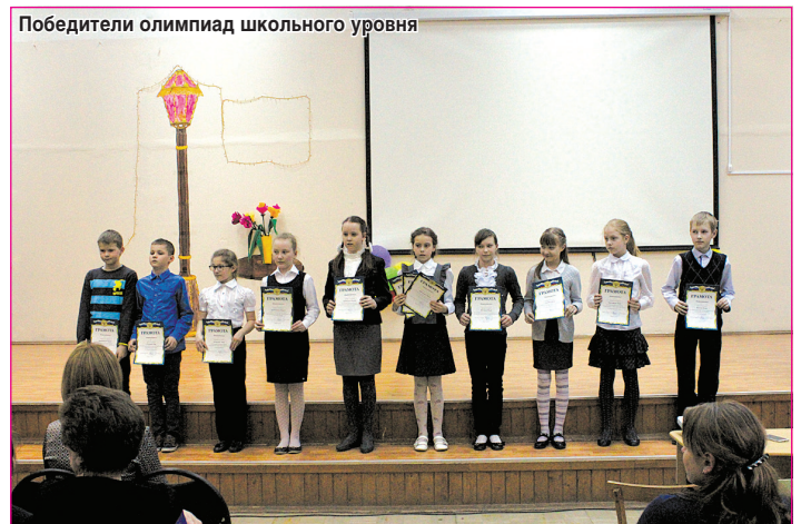
Победители олимпиад школьного уровня