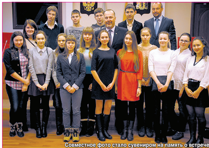
Совместное фото стало сувениром на память о встрече

Представители Ярославской областной думы 15 января встретились с учащимися школы № 48.