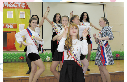
Танец на сцене.