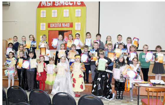
Фото с призерами и победителями предметной недели