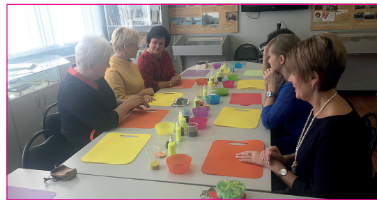
Сеанс песочной терапии.

Красивую мелодию «Калинка» исполнила на флейте четверокласс-