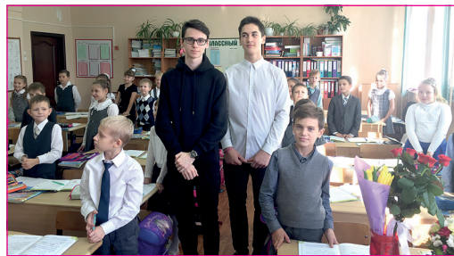
Идёт День самоуправления.

День учителя в нашей школе всегда включает в себя День самоуправления. В этот волшебный период времени старшеклассники заменяют педагогов.