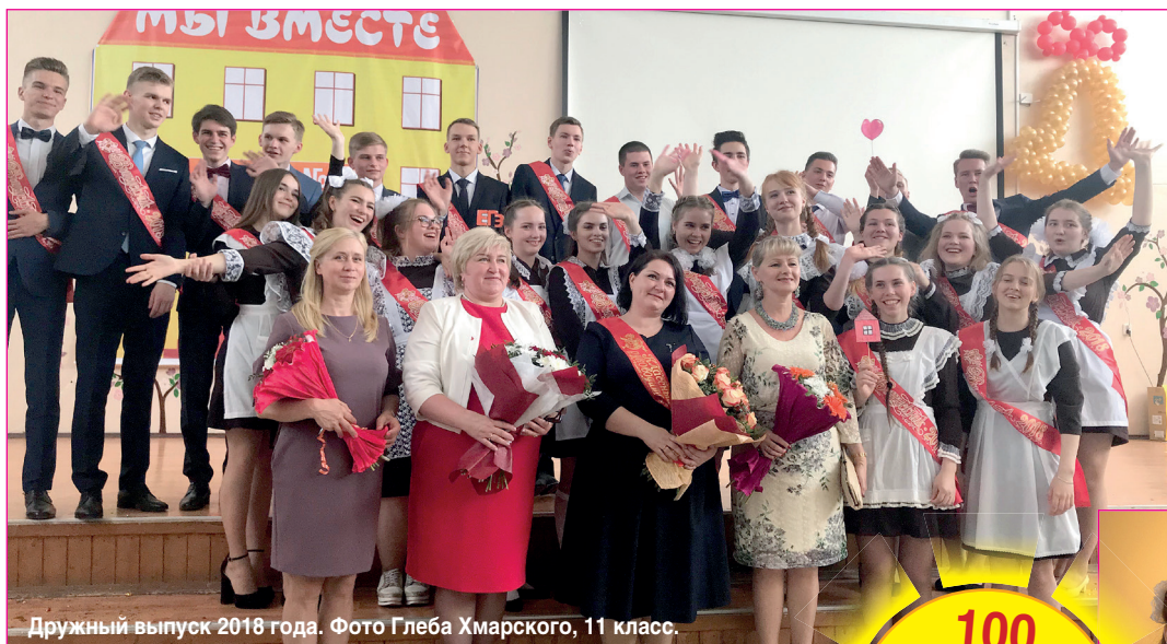
Дружный выпуск 2018 года.