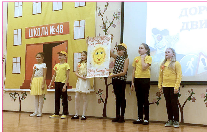
Участники состязаний на знание Правил дорожного движения.