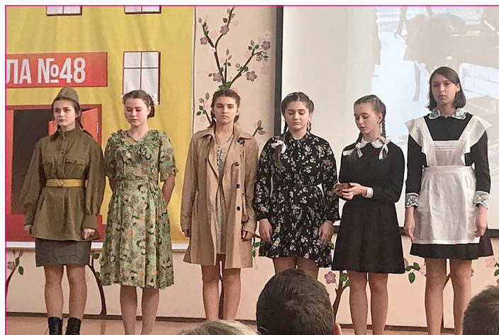
Участники композиции на сцене актового зала.

В Ленинграде работали театры и музеи. В блокаду не умолкло ленинградское радио. Для многих оно было единственной ниточкой, позволявшей почувствовать, что город живёт. Поэтесса и писательница Ольга Федоровна Берггольц ста-