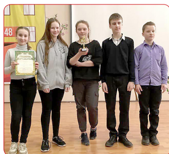
Наш корр. На снимках: участники и победители игр по Правилам дорожного движения.

В феврале сотрудники Госавтоинспекции г. Ярославля провели лекции, направленные на формирование навыков безопасного поведения на дорогах и улицах города, а также популяризации использования световозвращающих элементов. Слушателями стали учащиеся 2– 11 классов.