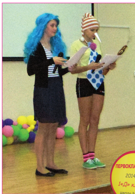
ПЕРВОКЛАССНИК 2014г. 1«Д» класс школа № 48

Открыл праздничное действо Буратино, который нашел заветную дверцу в Страну знаний. Вот как этот веселый персонаж обратился к зрителям со сцены: