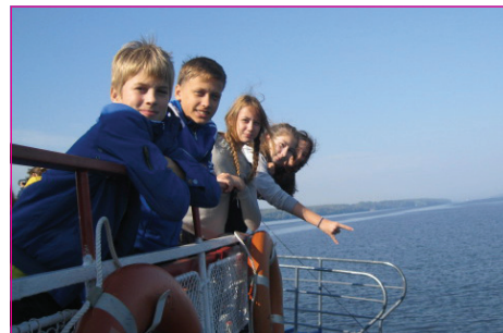
Счастливые моменты фестиваля в «Решме» не забудутся.

Все команды посадили деревья на Аллее Славы и приняли участие в конкурсе рисунков на асфальте «Решма» – территория здоровья». Запомнился, кроме того, костер, которым завершился этот интересный фестиваль, давший много пользы и новых впечатлений юным ярославцам из школы №48.