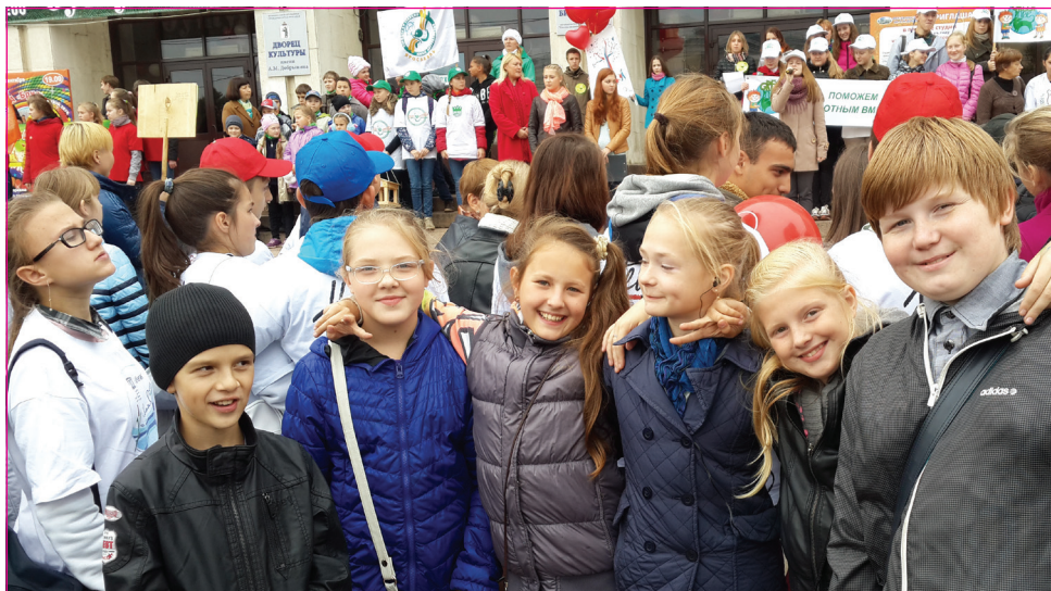
Ребята из 5 «А» на открытии Дней добрых дел в ДК им. Добрынина.